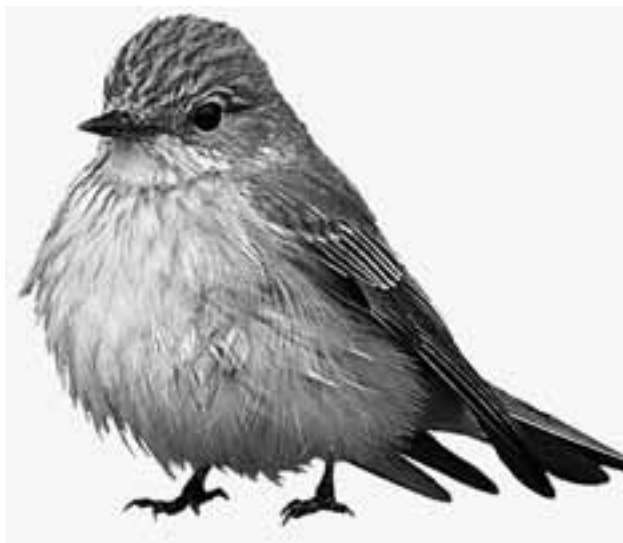
Grå flugsnappare.

Något som verkligen upprörde Munthe vara att fåglarnas ögon brändes sönder så att de sjöng oavbrutet. Munthe skriver i en fotnot: ”Efter många års kamp, i vilken jag har haft en blygsam del, är denna grymhet nu förbjuden i Italien”.