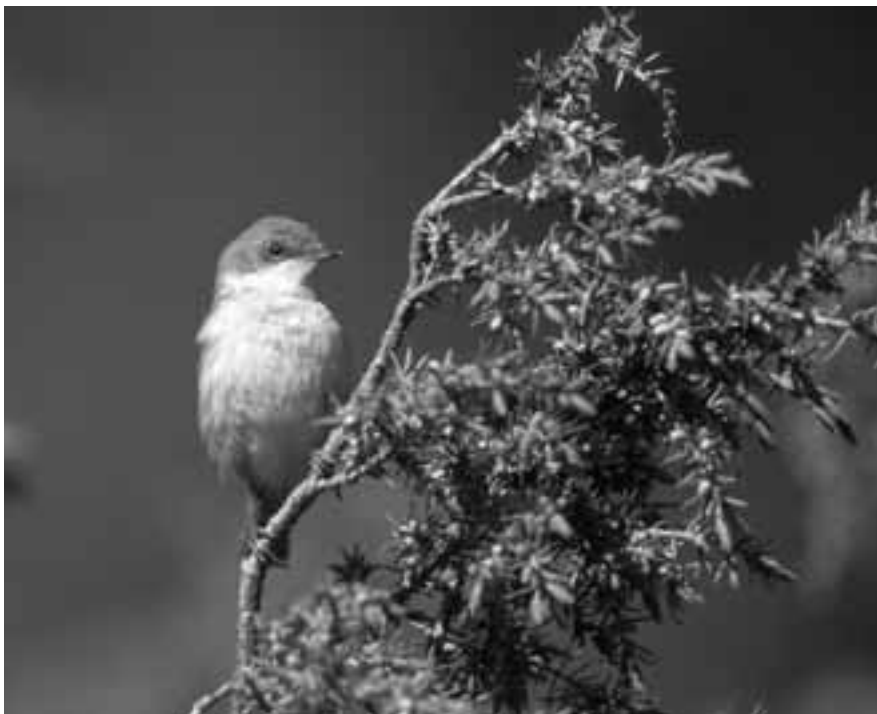
Ärtsångare.

Kanske Munthe någon gång får rätt när han hävdar att ”Den dag skall komma, när man inte längre ska rycka på axlarna, när man ska förstå att djurvärlden av Skaparen ställdes under vårt beskydd och inte under vår fria domvärjo, att djuren har lika stor rätt att leva som vi och att vår rätt att ta deras liv är strängt begränsad till självförsvar och uppehälle. Den tid kommer när lusten att döda ska dö ut hos människan. Så länge den finns har hon ingen rätt att kalla sig civiliserad, hon är endast en barbar...”