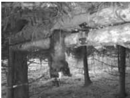
Exempel på årlig jakt i Sverige, fångad mård.

Minskningen är mycket tydlig. Från att ha skjutits i ca 30 000 ex på 1980-talet skjuts nu alltså 7000.