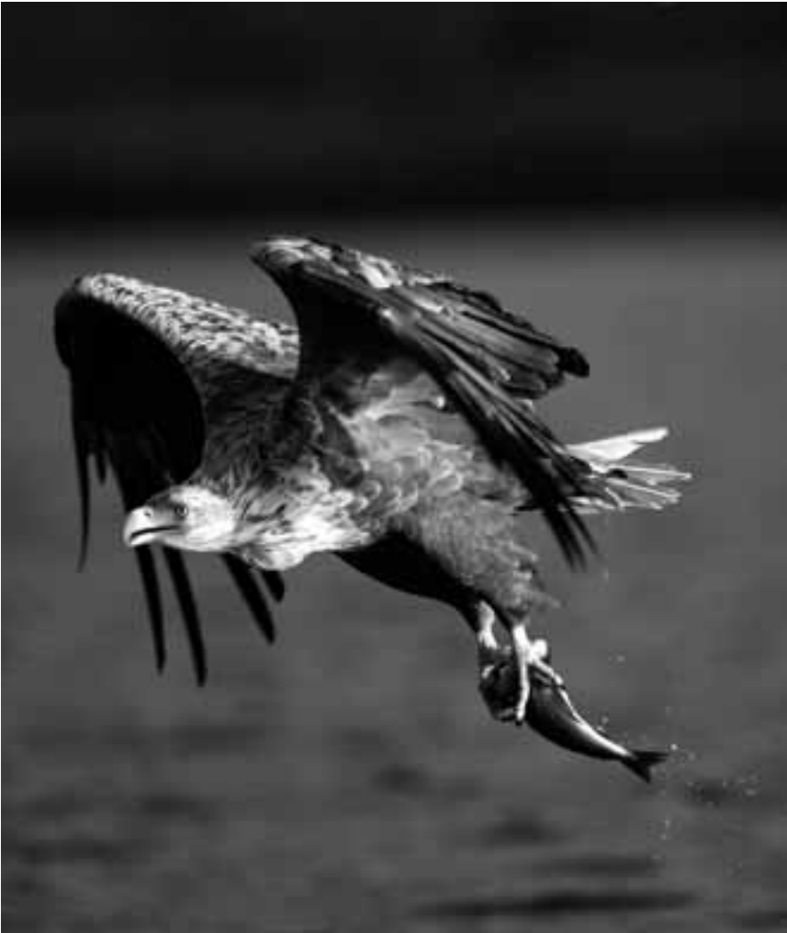
Havsörn med byte i klorna, augusti 2006