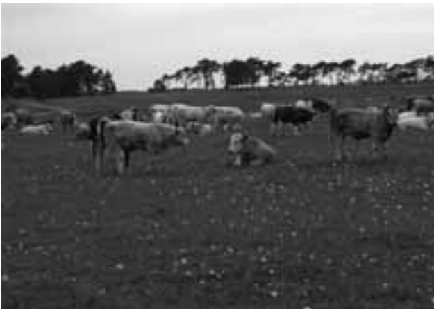
Tama men i ”frihet” innan de blir biffar på tallrikar.

Jag är själv vegetarian sedan många år men ser inte livet som heligt utan anser att djur skall kunna slaktas på ett så snabbt och smärtfritt sätt som möjligt. Ekologiskt hållna grisar och får som hemslaktas i lugn och ro