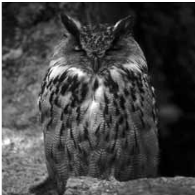
Berguv (hägn).

tenfyllas och bli Öresund. Under medeltiden var den vanlig på olika håll i Europa och anses ha spelat en viktig roll som renhållningshjon mitt inne i London. Om gladan hade övervägande goda tider då, så lurade bad times runt hörnet.