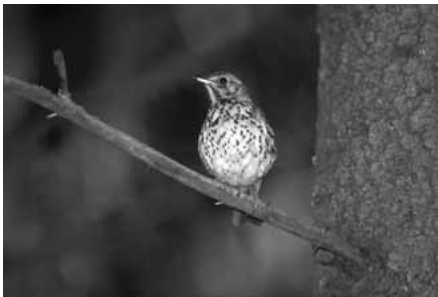
Taltrast.