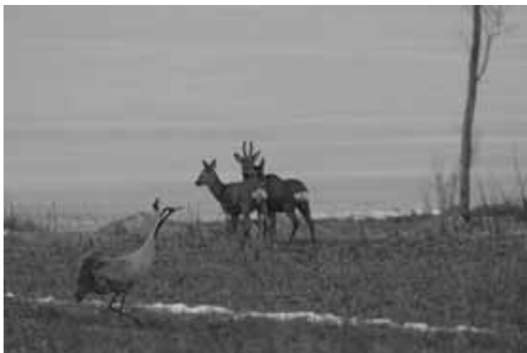
Rådjur och trana.

Vårens pånyttfödelse är lika fantastisk varje år.